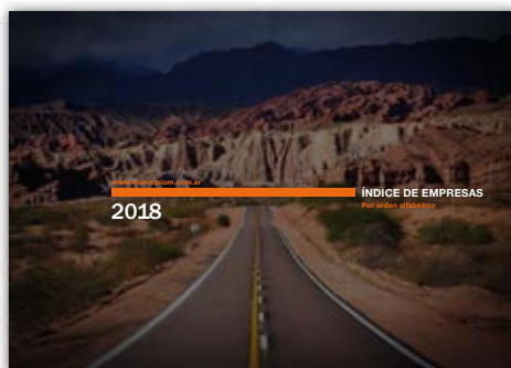
Doble página para presentar cada área