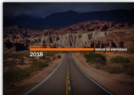
Doble página para presentar cada área