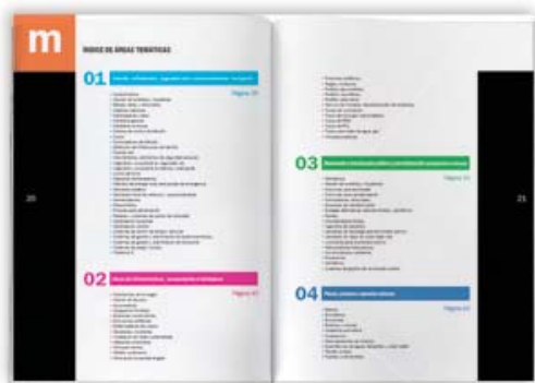
Índice de áreas y productos