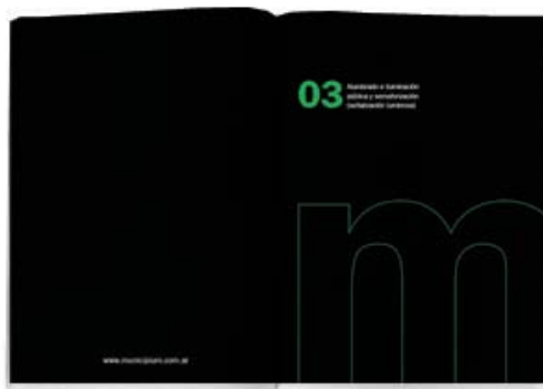
Doble página para presentar cada área